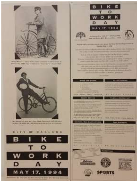
Bike to Work Day: El primer cuarto de siglo

El Lakeside Green Streets Project ha estado en construcción desde otoño de 2016. El largo tiempo que esto ha tomado es debido a modificaciones significativas en el lado oeste del lago Merritt, incluyendo la expansión del terreno frente al lago y del Snow Park, y la realineación completa de la carretera. La larga espera por la fase final del proyecto de rayado ofreció una oportunidad para revisar el diseño y llevarlo a una mayor sintonía con el pensamiento moderno sobre carriles para bicicletas de gran calidad; en este sentido, no hay mejor lugar para tal carril que al lado de la joya de Oakland. Actualmente, se construye una pista de ciclismo de dos vías protegida en zonas seleccionadas, donde originalmente se habían propuesto solo carriles para bicicletas con parachoques. ¿Hacia el sur en bicicleta? No se preocupe, también habrá carriles para bicicletas en el otro lado de la calle.