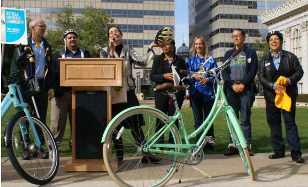
Thị trưởng, năm thành viên Hội đồng Thành phố Oakland và một chiếc xe đạp thuộc chương trình chia sẻ xe đạp Bay Area BikeShare (ảnh trái) trong Ngày Đạp Xe Đi Làm